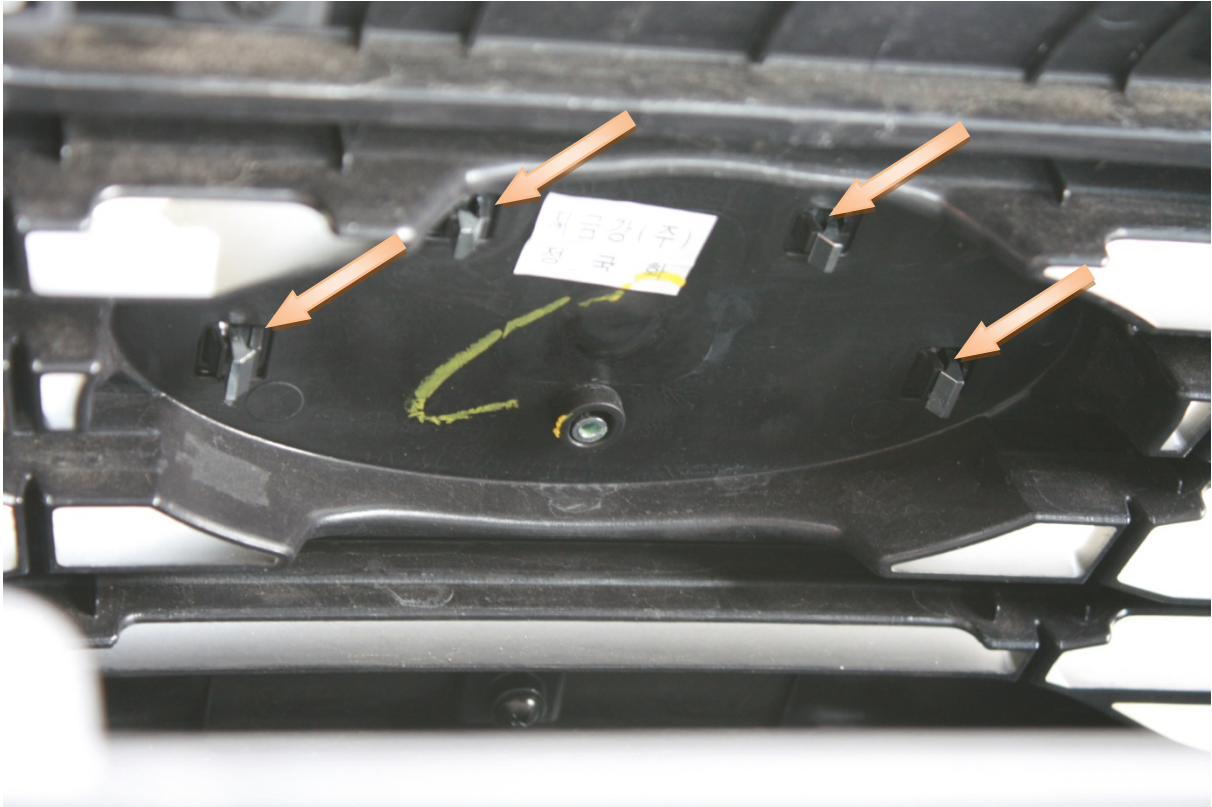
(Frontgrill von hinten aufgenommen)

Wenn ihr das KIA Emblem ausbauen wollt, müsst ihr noch einen weiteren Arbeitsschritt durchführen: